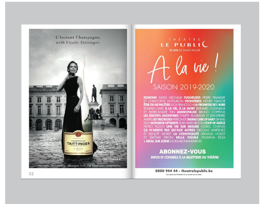
Page de publicité dans les programmes

Associez votre marque, votre produit, votre entreprise à notre lieu culturel synonyme d'un malin plaisir. N'hésitez pas à nous contacter pour élaborer un projet sur mesure.